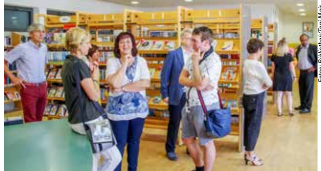
Die Feier am 16. Juni war gut besucht.