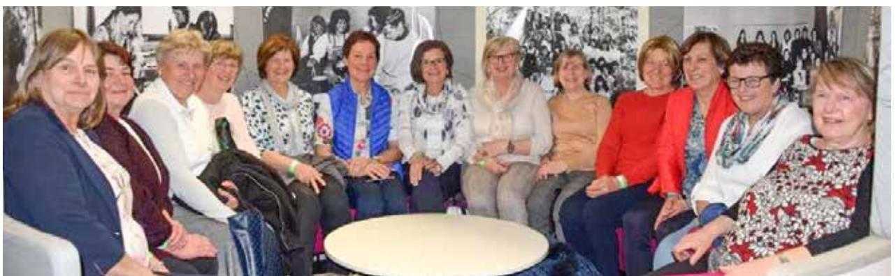
13 Absolventinnen des Jahrgangs 1975/76.