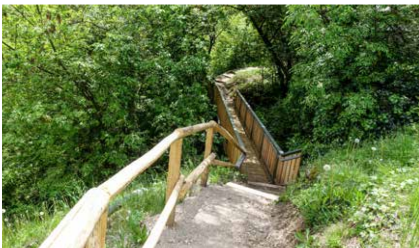
Die neue Brücke über den Prissianer Bach wurde einladend gestaltet.

Die Forstbehörde hat vor kurzem in Zusammenarbeit mit dem Tourismusverein Tisens-Prissian den Wandersteig Nr. 17 und den Erlebnisweg Vorbichl saniert. Der Wandersteig Nr. 17 führt bei Katzenzungen und unter dem Laubdach der Versoaln-Rebe, der größten und wohl auch ältesten Rebe der Welt, zum Prissaner Bach hinunter und die andere Talseite wieder hinauf. Auch die Brücke über den Bach sowie die Holzgeländer entlang des gesamten Wandersteigs wurden erneuert. Ebenfalls in Zusammenarbeit mit der Forstbehörde saniert wurde der Erlebnisweg Vorbichl: Komplett erneuert wurden die Holzumzäunungen und einige der großen Tafeln, auf denen