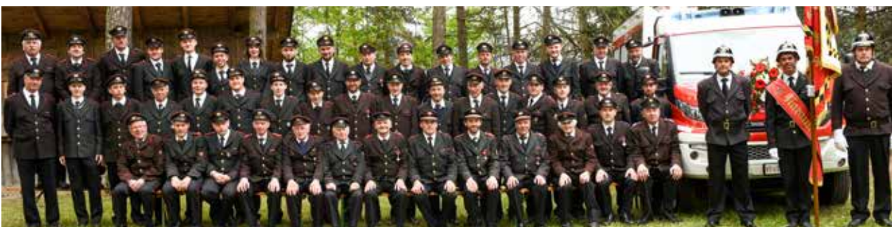
Die Narauner Feuerwehr: Ein wichtiger Teil des Zivilschutzes in der Gemeinde Tisens.