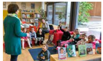
Die Schülerinnen und Schüler der ersten Klasse hören eine Ostergeschichte.