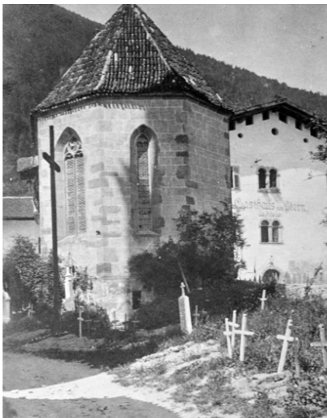
Michaels-Kapelle und Friedhof in Tisens, um 1910. Der begrenzte Raum auf dem Gottesacker erforderte eine ehestmögliche Exhumierung der Verstorbenen und die Aufsichtung ihrer Knochen in Beinhäusern.