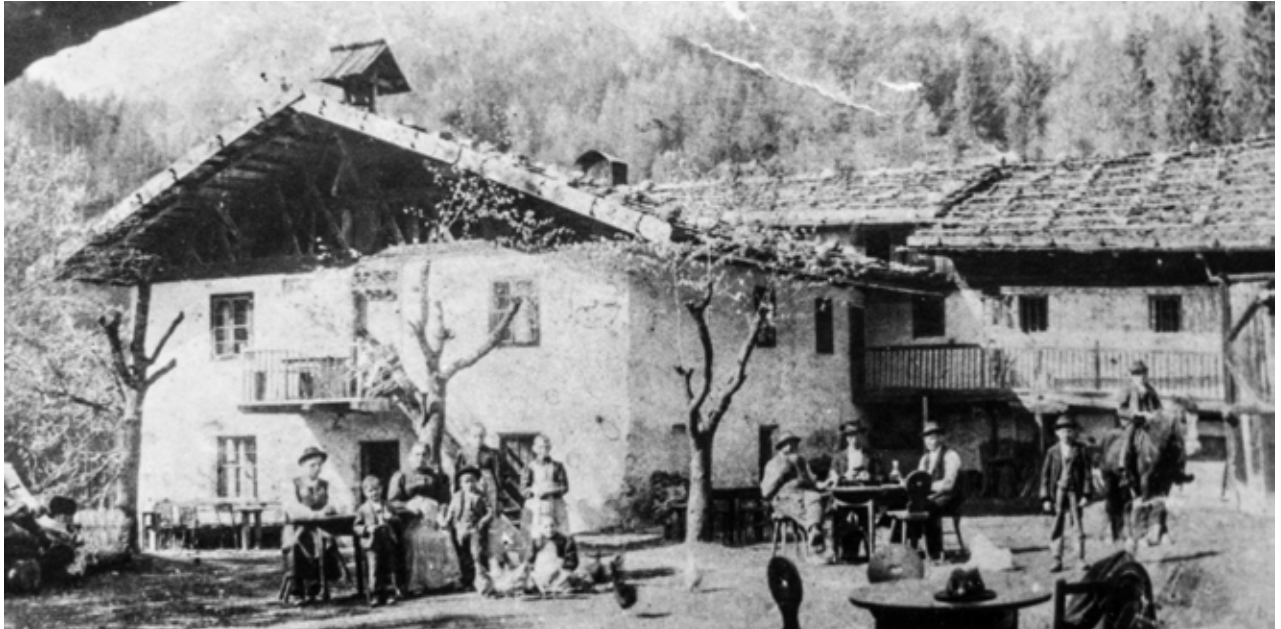
Das Völlaner Badl vor dem Ersten Weltkrieg.