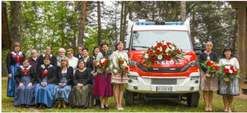
Die Narauner Wehr hat zahlreiche Patinnen.