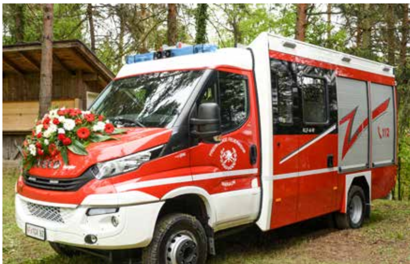
Dank des neuen Einsatzfahrzeuges ist die Freiwillige Feuerwehr Naraun noch besser für den Ernstfall gerüstet.