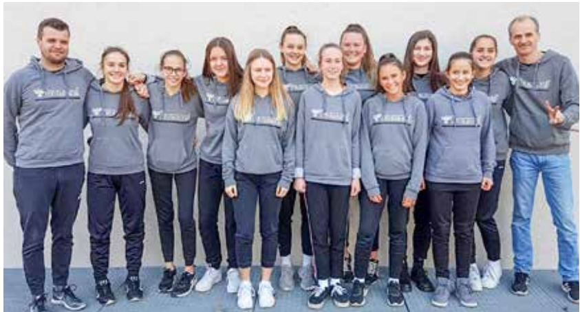
Auch auf die U15- und U17-Mannschaften kann der ASC Laugen Tisens zu Recht stolz sein.