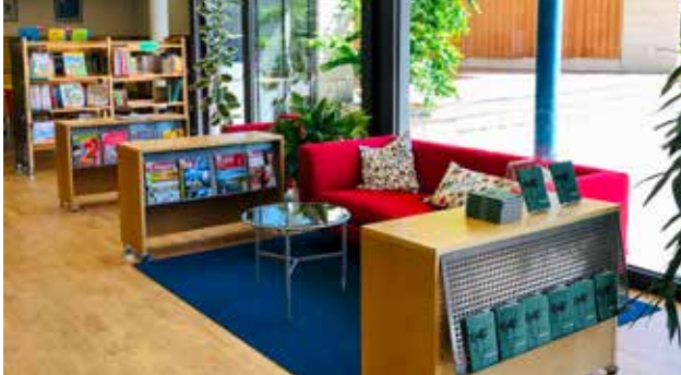
Die neue gemütliche Zeitschriftenecke.