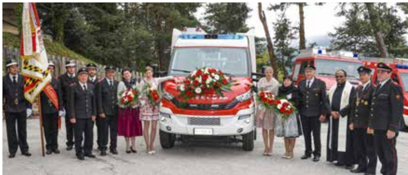
Fahnenabordnung, Patinnen, Feuerwehrspitze und Ehrengäste bei der Segnungsfest in Naraun.