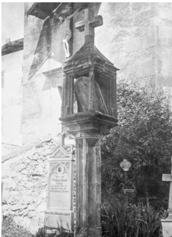
Die gotische Lichtsäule auf dem Tisener Friedhof stammt aus dem frühen 16. Jahrhundert.