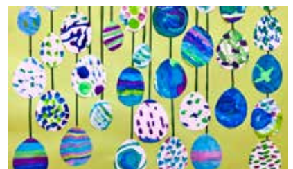
Viele bunte Ostereier. Danke an die erste Klasse fürs Mitmachen!