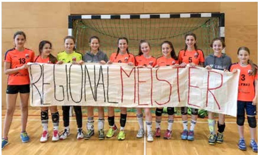
Die U13-Mannschaft zeigte ebenfalls großes Können.