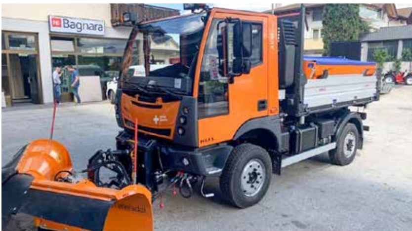
Dieser neue Geräteträger wurde für den Tisner Gemeindebauhof angekauft.

Juni geliefert. Das Fahrzeug des Typs AEBI Schmidt MT750, das Aufbaustreugerät des Typs AEBI F 1,7 und der Keilschneepflug der Marke AEBI wurden zum Gesamtpreis von 147.800 Euro (ohne MwSt.) angekauft. Durch dieses Fahrzeug soll die Schneeräumung in den engen Gassen des Dorfkentrums erleichtert werden. Zudem steht mit der Neuanschaffung auch ein vielseitig einsetzbares Fahrzeug für die warme Jahreszeit zur Verfügung.