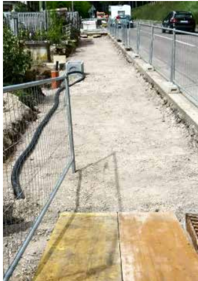
Geld aus dem Salvini-Dekret ist in den Bau des Gehsteigs an der Gampenpassstraße in Gfrill geflossen.

Zur Verbesserung der Sicherheit für die Fußgänger wird neben der Gampenstraße ein Gehsteig errichtet. Die entsprechenden Arbeiten sind im Gange und werden mit staatlichen Geldmitteln, die für diesen Zweck bereitgestellt wurden, finanziert. Die Firma Baumichl des Michael Kofler wird die Arbeiten (Kosten von insgesamt 18.674,05 Euro ohne Mehrwertsteuer) innerhalb zwei Wochen fertigstellen.