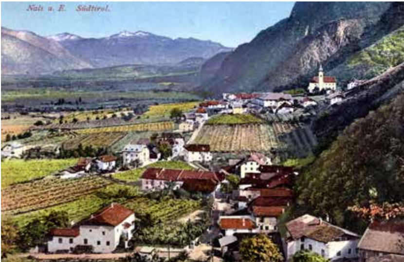
Nals um 1900: Damals prägte noch der Weinbau die Dorflandschaft.

„Knappenloch“ gleich außerhalb Nals, welches mir ein Bauer wies, um mir etwas „Neugieriges“ zu zeigen - es ist die Mündung eines Stollens, in welchem vor Jahrhunderten auf allerlei Metalle gebaut wurde - sieht man hoch oben auf dem Berggrücken links den Kastanienwald des Dörfchens Sirmian - über der tieferen Schlucht, welche braun aussieht, weil man ihren Baumwuchs vernichtet hat, glänzt bis tief herab der Schnee der Mendel - vor einer Kapelle