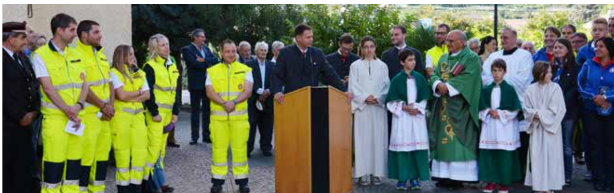
Der Festakt fand vor der Heilig-Kreuz-Kirche in Lana statt.