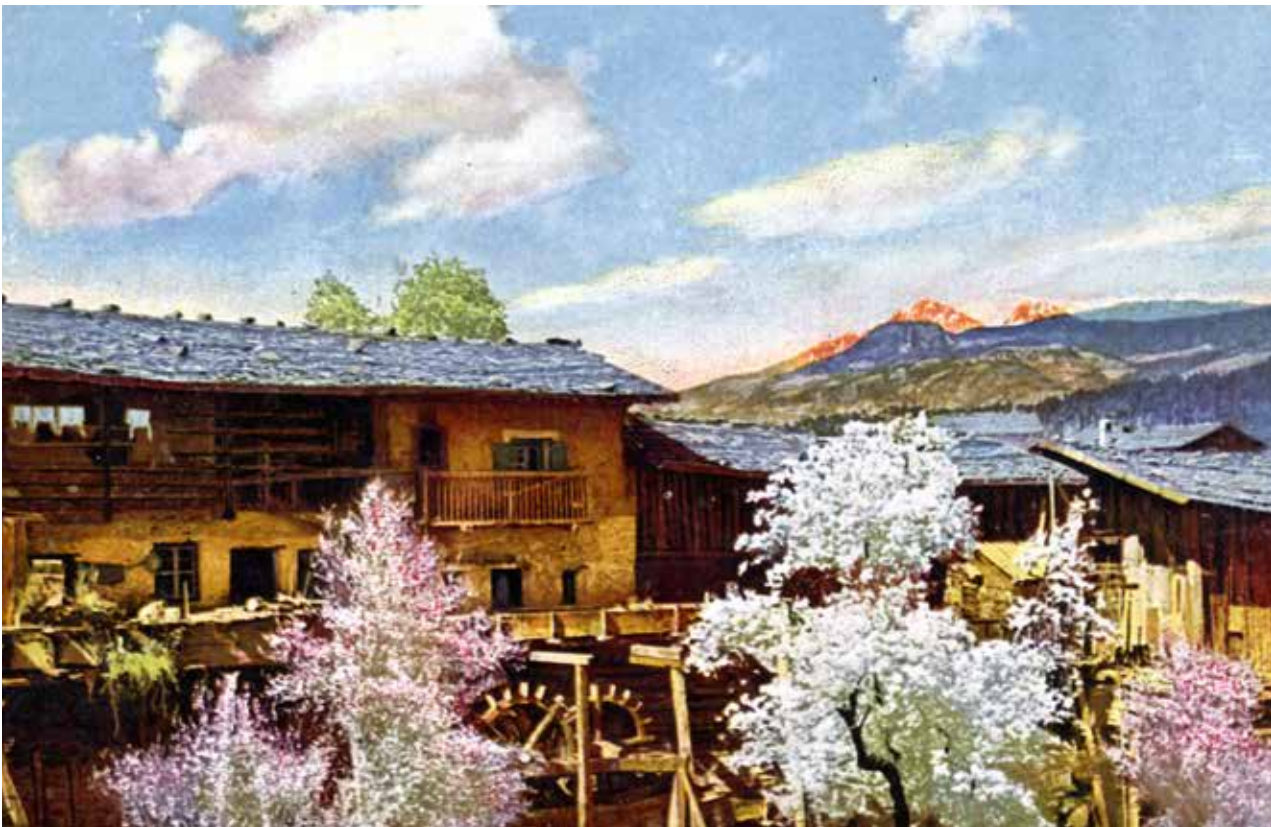
Die Kofelmühle in Prissian war einer von mehreren Betrieben des Dorfes, der die Wasserkraft des Baches nutzte.

Hier folgt die detaillierte Beschreibung einer Froschjagd in den Etschauen. Die gefangenen Frösche dienten in der vorösterlichen Zeit als willkommene