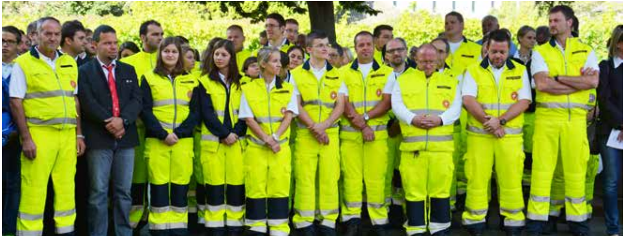
Die Helfer beim Festakt.