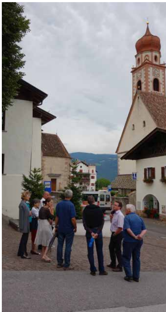
Die Ortsbegehung führte durch den Hauptort Tisens.

Anhand diverser, zum Teil laufender bzw. noch zu vollendender Bauprojekte wurden positive und negative Auswirkungen auf das Ortsbild angesprochen. Auch wurde auf die Bedeutung und den Wert geschlossener, gassen-